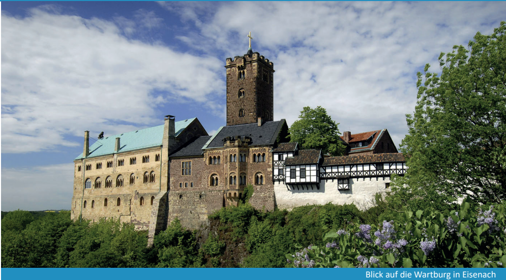
Blick auf die Wartburg in Eisenach