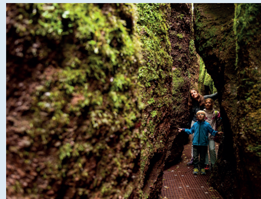
Drachenschlucht bei Eisenach

„Bei dieser Reise sind Sie in unserem eigenen Gästehaus untergebracht (siehe S. 4). So lernen Sie die herzliche Thüringer Gastfreundschaft kennen und gleichzeitig unterstützen wir Sie gerne bei der Planung Ihrer Tagestouren. Gerne beraten wir Sie auch zu weiteren Touren und möglichen Verlängerungsnächten.“