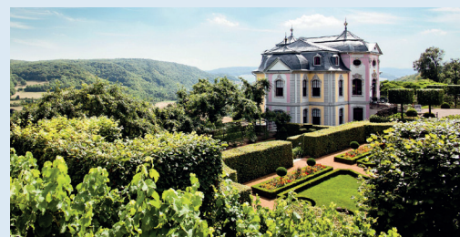
Rokokoschloss mit Barockgarten in Dornburg