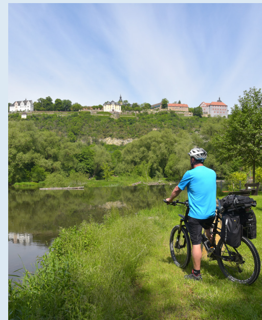
Radfahrer an den Dornburger Schlössern