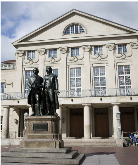
Weimar: Goethe und Schiller mit Theater