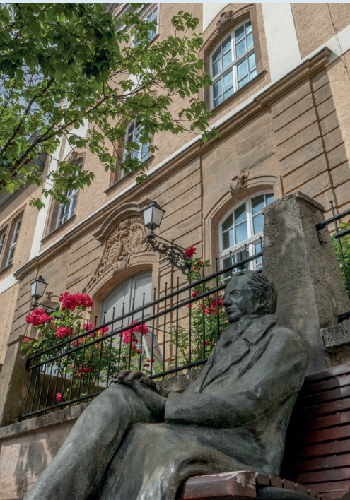
Goethe in Ilmenau

Sie radeln weiter talabwärts, in Fließrichtung der Ilm. Es geht vorbei an Flussauen mit Weiden und Erlen, die von imposanten Kalkwänden umragt werden. Ab und an sammelt sich das Wasser der Ilm in kleinen, idyllischen Seen. Nach einer schönen Fahrt bietet sich eine Mittagsrast in Stadtilm an. Vor Ort können Sie sich persönlich überzeugen, warum diese auch den Beinamen die „Stadt der sieben Wunder“ trägt. Sehenswert ist auch der größte Marktplatz Thüringens! Nach etwas Kultur treten Sie wieder kräftig in die Pedalen.