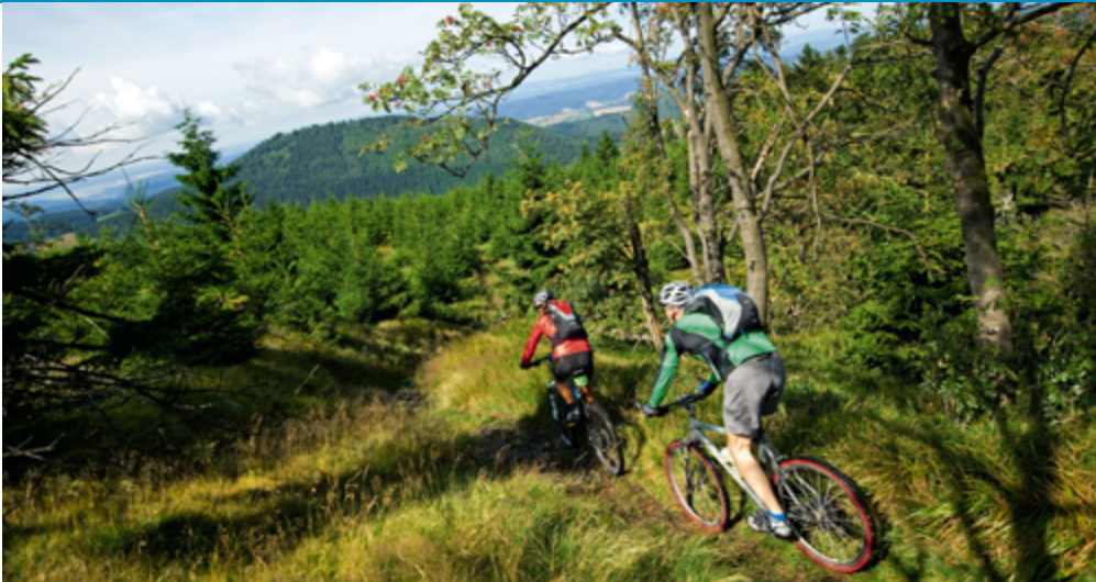
Entdecken Sie den Thüringer Wald