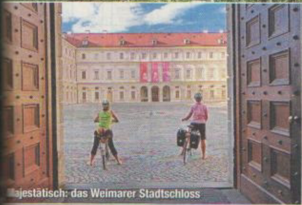
Majestätisch: das Weimarer Stadtschloss

Ein Blick auf die Wartburg: Der Radfernweg „Thüringer Städtekette“ beginnt in Eisenach und führt über Weimar mit seinem prächtigen Stadtschloss (F.I.) nach Altenburg, dem Geburtsort des Skatspiels