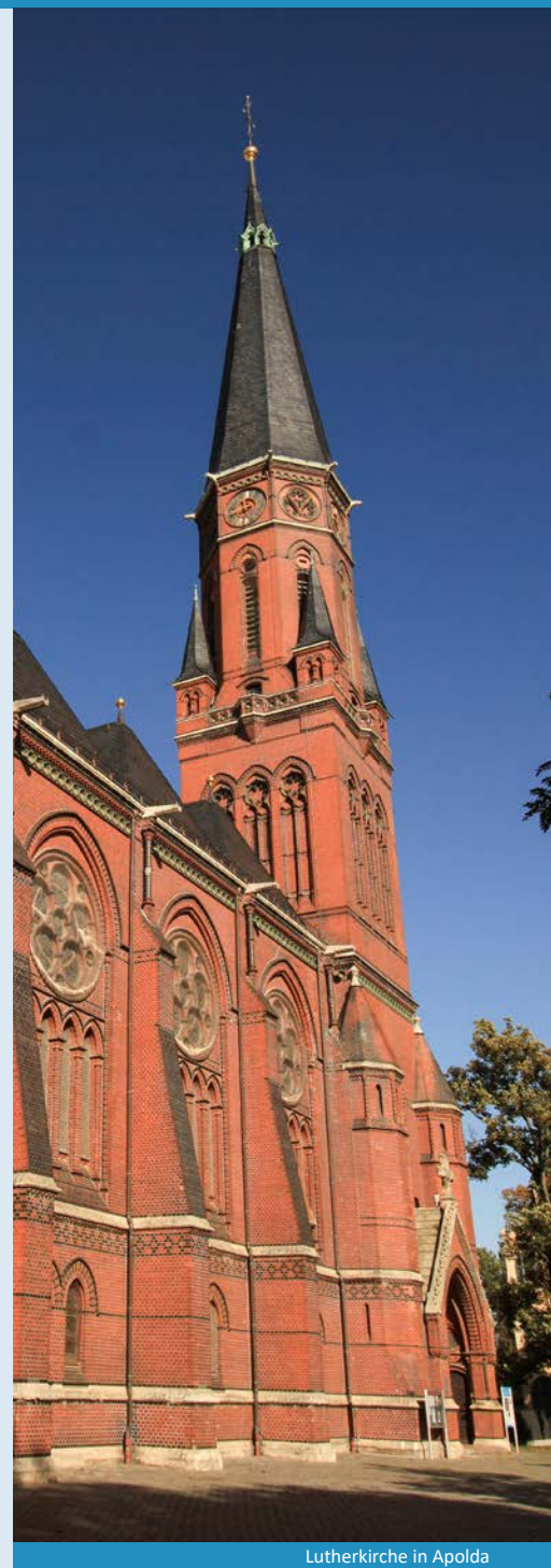
Lutherkirche in Apolda