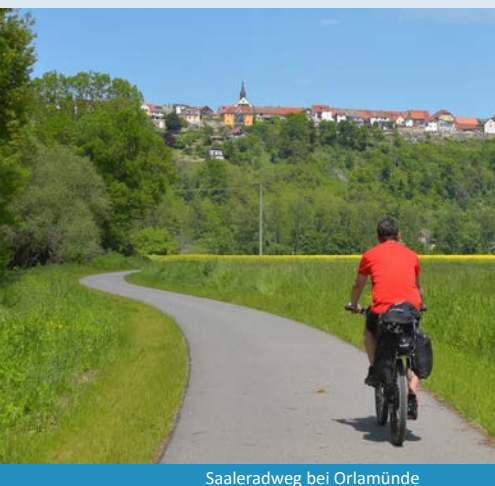
Saaleradweg bei Orlamünde

Anfangs radeln Sie flussaufwärts in Richtung Bad Kösen mit seinem bekannten Gradierwerk. Ab Kleinheringen folgen Sie der Ilm, passieren die Glockenstadt Apolda – und schließlich geht es zurück in die Stadt der Dichter und Denker nach Weimar.