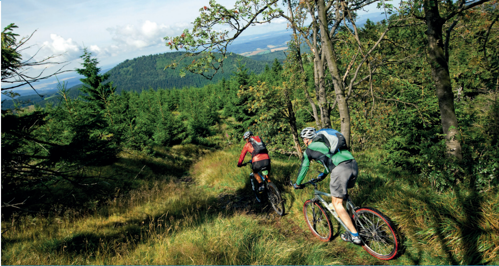
Entdecken Sie den Thüringer Wald